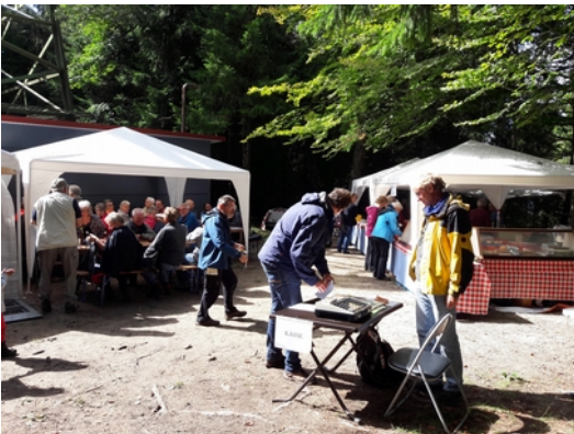
Tag der Heimat