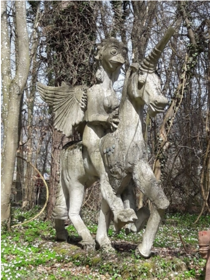
Bruno-Weber-Park in Aarau